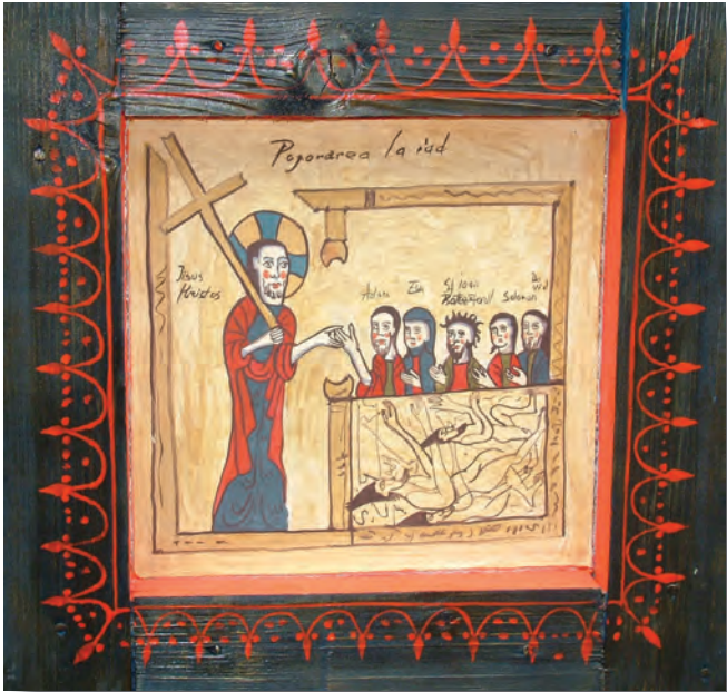
Pogorarea la iad. Autor: Sorin Efros, 2005.

tului, dar vii pentru Dumnezeu, în Hristos Iisus, Domnul nostru” (Romani 6, 11). Hristos ne dă puterea să trăim moartea tainică cu El, moartea egoismului păcatului, ca predare lui Dumnezeu, într-o continuă dezvoltare, pentru ca în momentul culminant al morții fizice, despărțirea sufletului de trup să coincidă cu intrarea culminantă în plenitudinea vieții: „Purtând totdeauna în trup moartea lui Iisus, pentru ca și viața lui Iisus să se arate în trupul nostru” (2Corinteni 4,10). Strigătul lui Iisus pe cruce: „Dumnezeul Meu, Dumnezeul Meu pentru ce M-ai părăsit?” își are iconomia sa în pregătirea noastră pentru acceptarea morții ca poartă spre învierea fericită cu El. Prin acest strigăt Iisus ne arată că a fost om adevărat și Și-a asumat condiția noastră, inclusiv moartea, și din dorința de a Se uni ca om deplin cu Tatăl, acceptă și durerile morții, ca noi să învățăm să acceptăm din iubire față de Hristos, această ultimă durere a vieții noastre pământești, cu credința că „nici moartea, nici viața... nu va putea să ne despartă pe noi de dragostea lui Dumnezeu, cea întru Hristos Iisus, Domnul nostru” (Romani 8, 38-39).